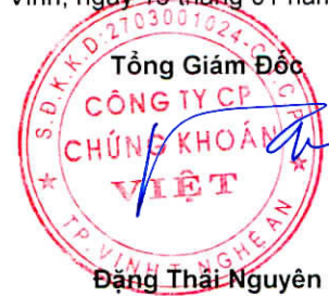
Đặng Thái Nguyên