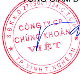
Đặng Thái Nguyên